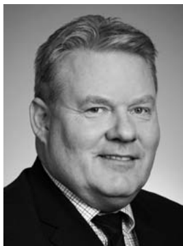
SIGURÐUR INGI JÓHANSSON sjávarútvegs- og landbúnaðarráð- herra umhverfis- og auðlindaráðherra 1. þm. Suðurkjördæmis Framsóknarflokkur