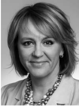
HANNA BIRNA KRISTJÁNSDÓTTIR innanríkisráðherra 1. þm. Reykjavíkurrkjördæmis suður Sjálfstæðisflokkur

Alþm. Reykv. s. síðan 2013 (Sjálfstfl.).