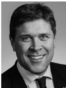
BJARNI BENEDIKTSSON fjármála- og efnahagsráðherra 1. þm. Suðvesturkjördæmis Sjálfstæðisflokkur