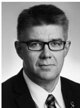
GUNNAR BRAGI SVEINSSON utanríkisráðherra 1. þm. Norðvesturkjördæmis Framsóknarflokkur