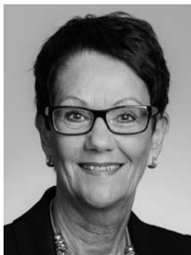
RAGNHEIÐUR RÍKHARÐSDÓTTIR 3. þm. Suðvesturkjördæmis Sjálfstæðisflokkur