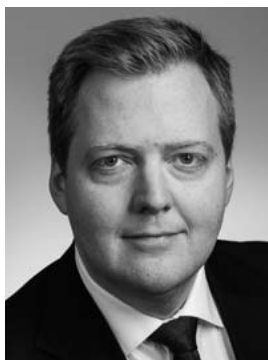
SIGMUNDUR DAVÍÐ GUNNLAUGSSON forsætisráðherra 1. þm. Norðausturkjördæmis Framsóknarflokkur

Alþm. Reykv. n. 2009–2013, alþm. Norðaust. síðan 2013 (Framsfl.).