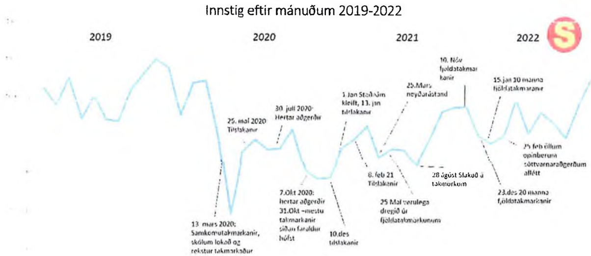
Mynd 1. Myndin sýnir þróun innstiga í vagna Strætó á tímabilinu 2019 til september 2022.