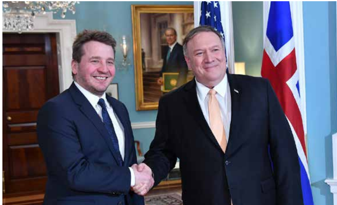
Utanríkisráðherrar Bandaríkjanna og Íslands, Mike Pompeo og Guðlaugur Þór Þórðarson, í Washington árið 2019.

staðfesti þann vilja á lokuðum fundi í Bandaríkjunum þar sem tveir öldunga-deildarþingmenn tóku málið upp og upplýsti að vinnuhópur á vegum stjórnarinnar væri að skoða málið. Í bakgrunnsmiðlun embættismanna til fjölmiðla voru umræður um fríverslun tengdar breyttum öryggisaðstæðum á Norðurslóðum og mögulegri þátttöku Íslands í Belti og braut. 38 Hin breytta nálgun gagnvart Íslandi sýndi að í Washington skildu menn að Ísland hafði ný spil á hendi.