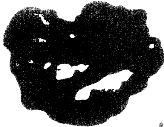
Útbreiðslusvæði NMT kerfisins