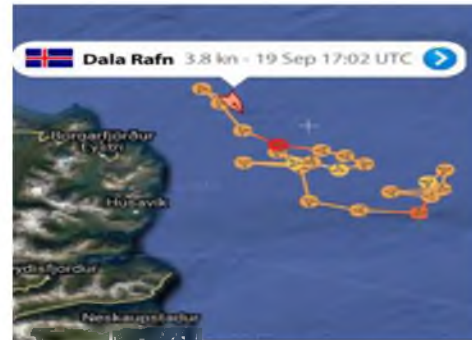
Mynd 3 & 4: Dæmigerðir ferlar togara á Borgarfjarðarmiðum. Tekið af marintraffic.com 2020

Það er útgerð staðarins og kjarnaatvinnugrein brothættrar byggðar algjörlega nauðsynlegt að Skápnium sé lokað eða í það minnsta minnkaður í suðurenda hans þ.a. togveiðar væru bannaðar innan 12 mílna frá Glettingsnesi og áleiðis norður að Héraðsflóa. Tímabundin lokun ár hvert frá júlíbyrjun til desember loka væri fullnægjandi. Núverandi fyrirkomulag er ógn við trilluútgerð í brothættri byggð. Varanleg úrlausn felst í því að gera lagabreytingu á lögum um fiskveiðilandhelgi Íslands nr. 79 frá 26. maí 1997. Það getur verið flókið mál að koma á lagabreytingum og því er bent á að þessu svæði hefur áður verið lokað seint á síðustu öld með reglugerð sem er tiltölulega einfaldari aðgerð en lagabreyting. Þá var nýverið lokað með reglugerð nr. 965/2019; Reglugerð um tímabundnar lokanir á veiðisvæðum á grunnslóð við Ísland, svæðinu grunnt við Glettingsnes fyrir handfæraveiðum frá 15. maí til 31. júlí ár hvert. Sambærileg reglugerð fyrir lokun togveiða (hluta árs) innan Skápsins væri akkúrat það sem til þyrfti.