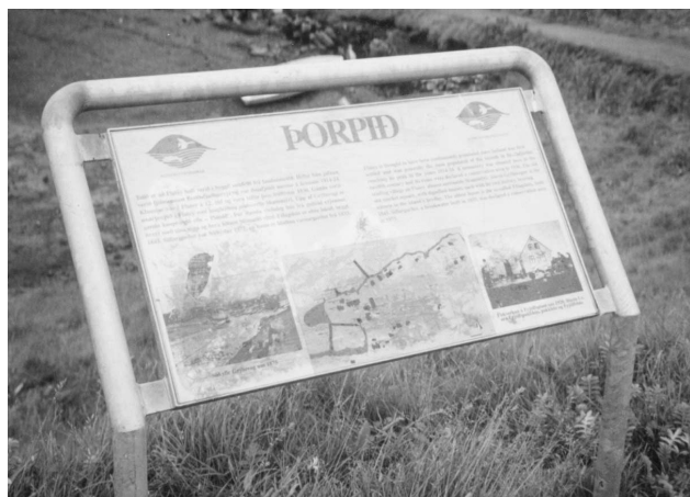
Fræðsluskilti Náttúruverndar ríkisins í Flatey á Breiðafirði.