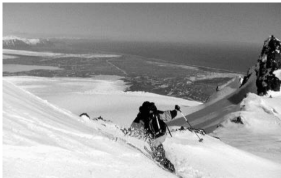
Á Vatnajökli er margs konar ferðaþjónusta eins og myndir frá Öræfaferðum sýna.

Meðal þeirra sem stunda rannsóknir á jöklinum og í nágrenni hans er Raunvísindastofnun