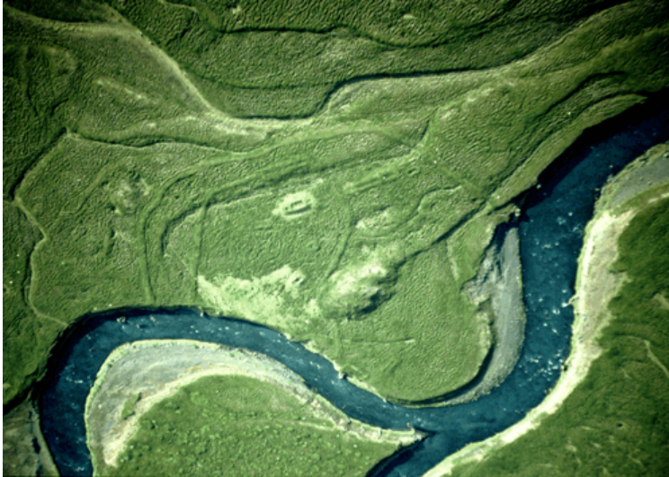
Loftmynd af Þingey, ljósmyndari Garðar Guðmundsson.

Rannsóknir í Þingey eru unnar í samstarfi við Hið Þingeyska fornleifafélag. Sumarið 2005 er áætlað að gera nákvæmar uppmælingar á rústum í eyrni og grafa nokkra könnunarskurði að auki til að komast nær um aldur rústanna og innri gerð þeirra.