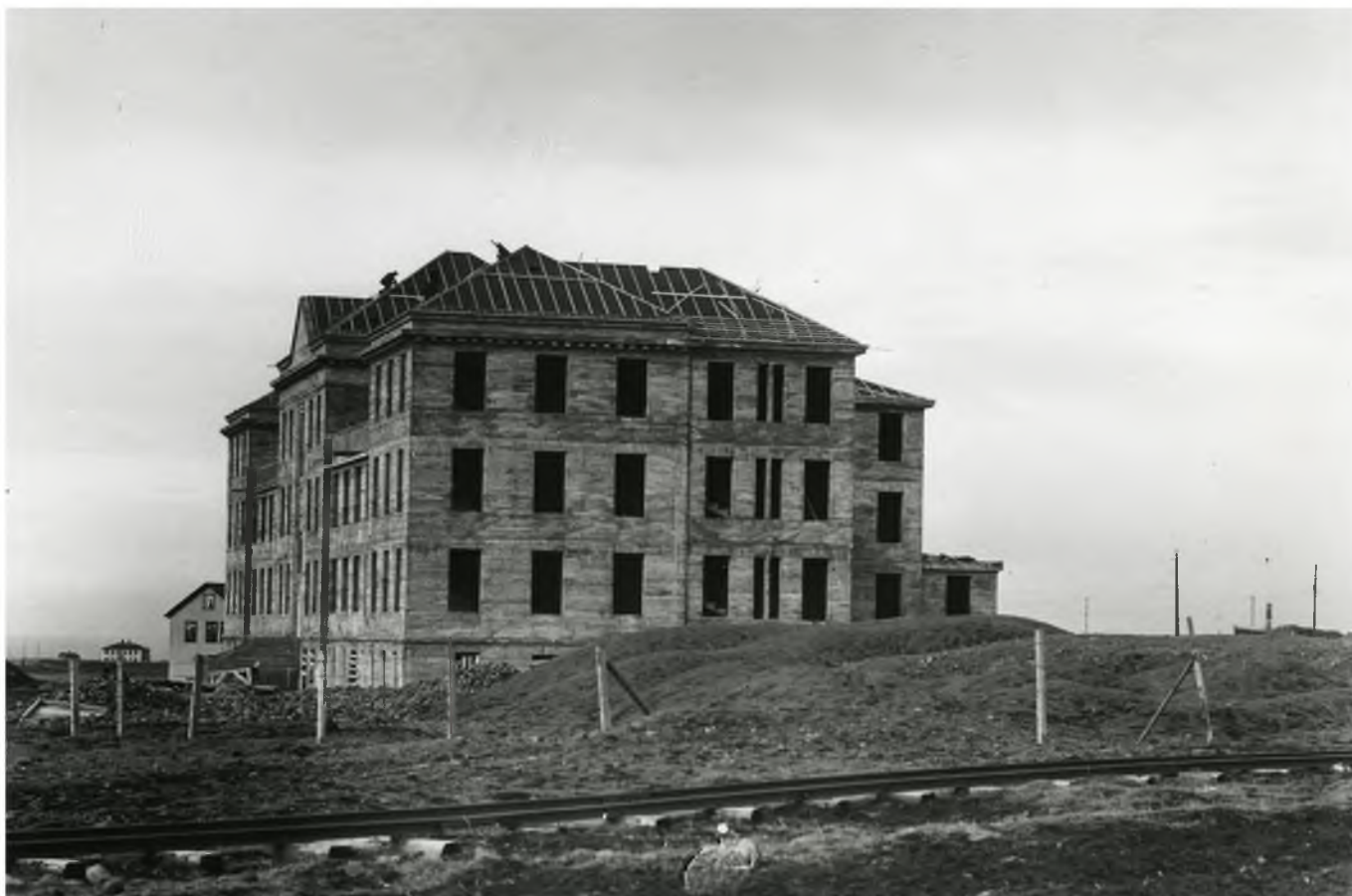
Aðalbygging Landspítalans við Hringbraut í byggingu. Ártal óþekkt.