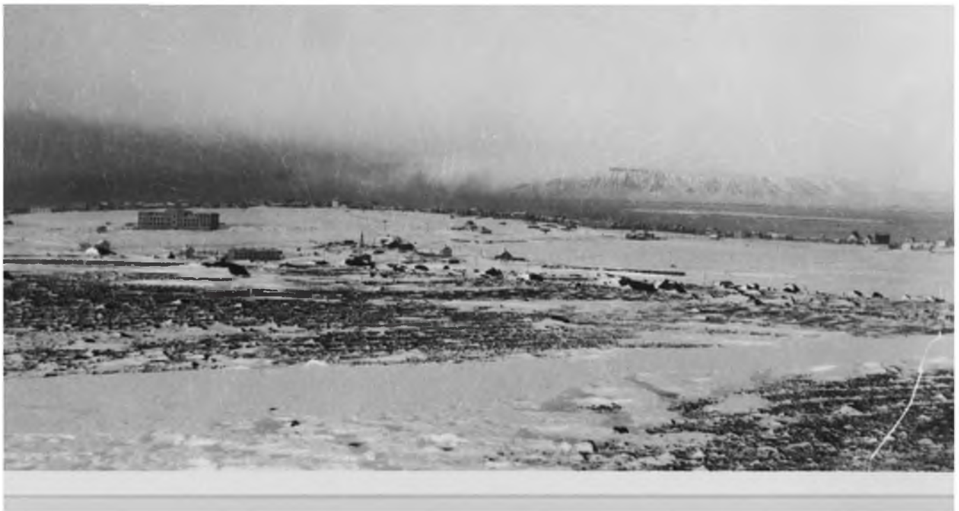
Yfirlitsmynd séð yfir Þingholt og Landspítalann, 1930–1931